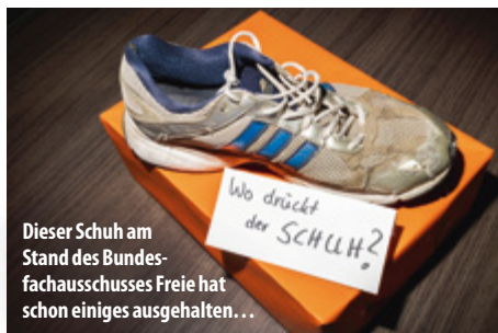
Dieser Schuh am Stand des Bundesfachausschusses Freie hat schon einiges ausgehalten...

Rund 200 Delegierte und Gremienmitglieder – darunter etwa 40 aus Bremen, Niedersachsen und Hamburg/Schleswig-Holstein – stimmten an zweieinhalb Tagen über annähernd 20 Anträge ab und zeigten sich dabei so einig und effizient wie selten: Alle gestellten Anträge wurden angenommen, keiner musste aus Zeitmangel, wie es bei Verbandstagen häufig der Fall ist, an den Gesamtvorstand zur Entscheidung überwiesen werden.