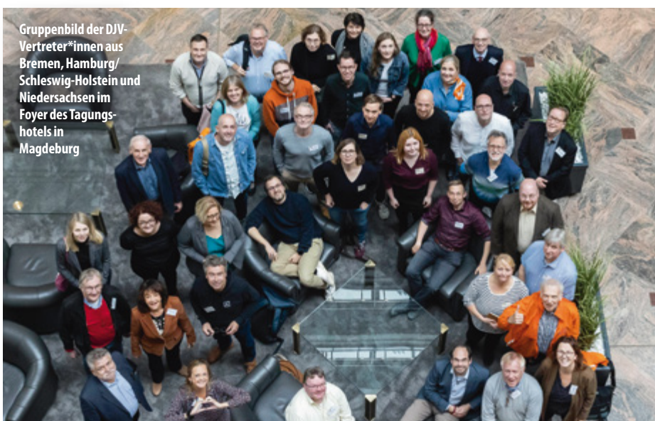
Gruppenbild der DJV-Vertreter*innen aus Bremen, Hamburg/Schleswig-Holstein und Niedersachsen im Foyer des Tagungshotels in Magdeburg