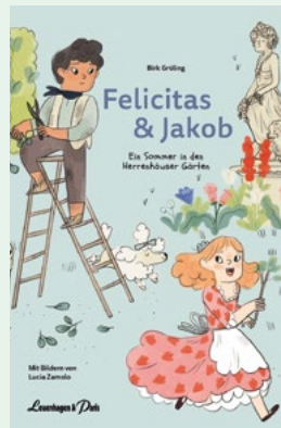
Felicitas und Jakob. Ein Sommer in den Herrenhäuser Gärten von Birk Grüling Leuenhagen + Paris, 122 Seiten, 14,99 Euro