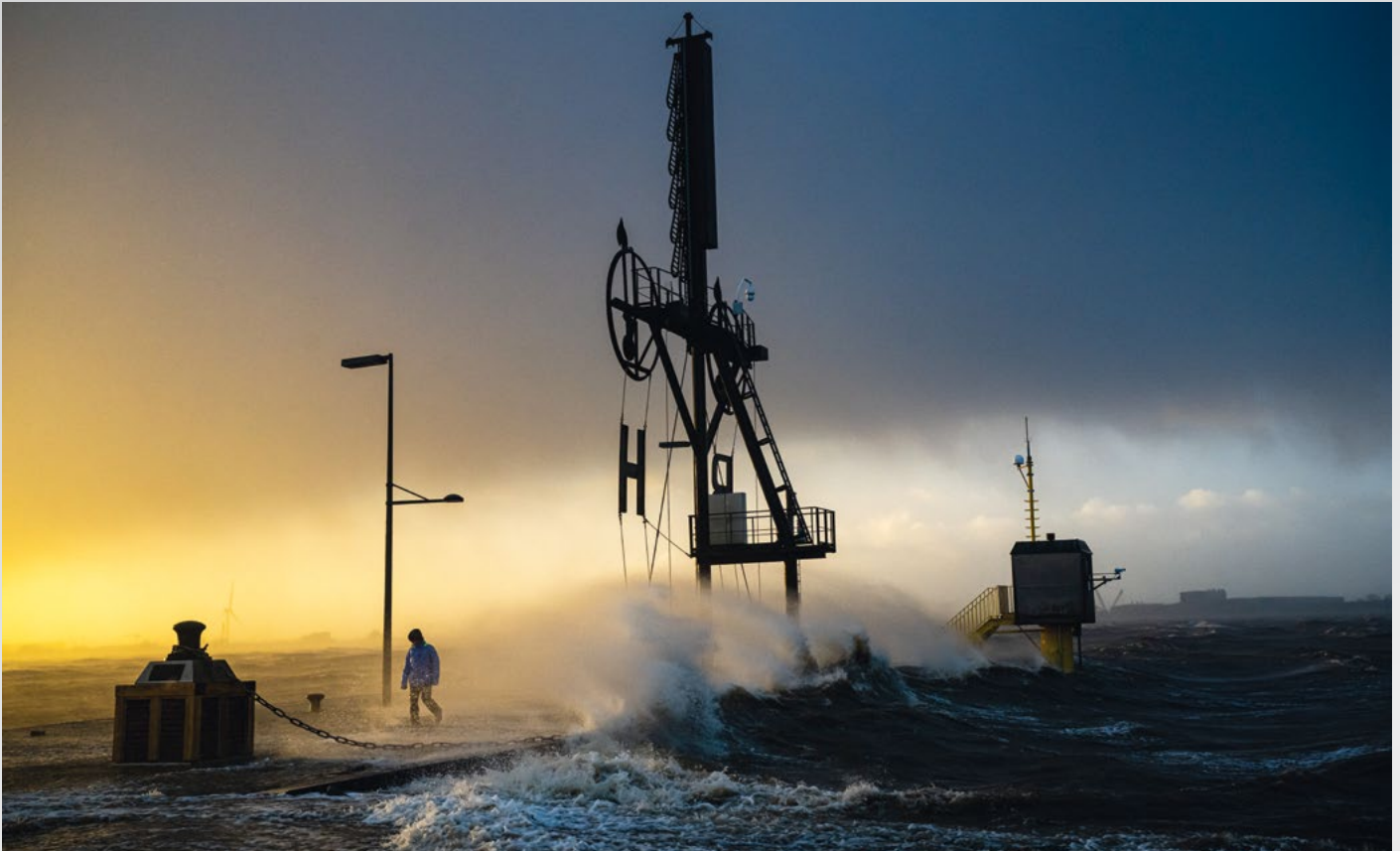
Gewinnerin Pressefoto des Jahres: Sina Schuldt Dieses Bild ist technisch einwandfrei aufgenommen worden und zeigt vor allem eines: das Drama der Sturmflut. Es vereint Bremen und Bremerhaven in einem Motiv und wird von der Jury aufgrund seiner Stimmigkeit zum Pressefoto des Jahres gekürt.