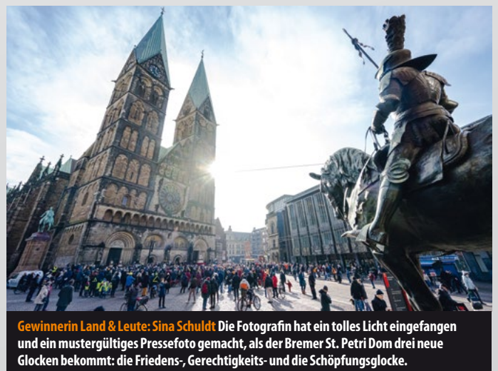
Gewinnerin Land & Leute: Sina Schuldt Die Fotografin hat ein tolles Licht eingefangen und ein mustergültiges Pressefoto gemacht, als der Bremer St. Petri Dom drei neue Glocken bekommt: die Friedens-, Gerechtigkeits- und die Schöpfungsglocke.