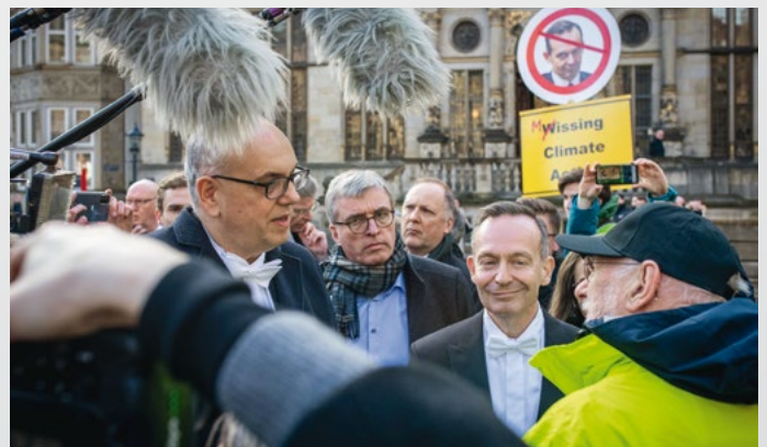
Gewinner Politik: Arnd Hartmann Der Fotograf hat hier einen echten Augenblick eingefangen, eine unverfälschte Emotion. Die Situation zeigt echte Reaktionen, ganz besonders, wenn man in das Gesicht von Verkehrsminister Volker Wissing blickt. Solche Situationen auf Fotos einzufrieren, gelingt nicht vielen Fotografen.